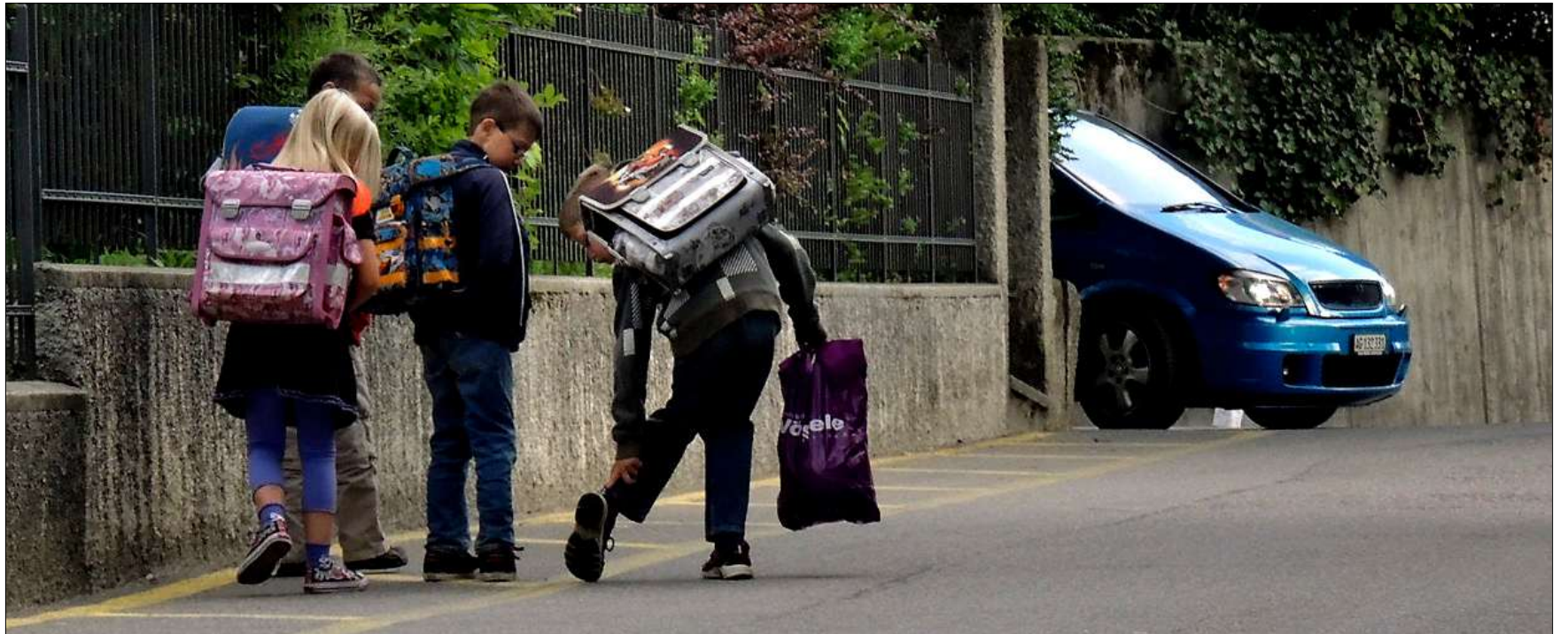
Wo drückt der Schuh? Ein harmloses Problem, das kommuniziert sein will – im Hinblick auf das nahende Fahrzeug aber gefährlich werden könnte

Nach Schulschluss am Mittag oder am späteren Nachmittag geht es lebhafter zu. Der Bewegungsdrang der Kinder nach langem Sitzen ist gross. Man