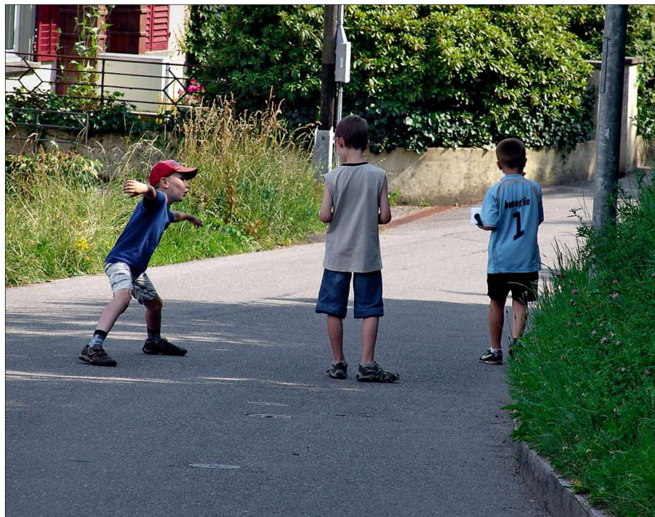
Kinder brauchen eine Bühne. Es geht nicht ohne (Strassen-)Raum und grosse Gesten

In seinem Eifer hatte der Junge nicht bemerkt, dass während seines Überholmanövers auf der Strasse ein rasch heranfahrendes Auto abrupt gebremst hatte. Als Zuschauer stockte mir der Atem.